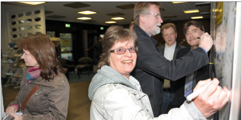
Aktion in der Dortmunder Direktion: Ende April informierten die Betriebsräte in den Foyers und sammelten Unterschriften gegen die Bürgerversicherung. Die anderen Standorte wurden oder werden ebenfalls noch besucht.